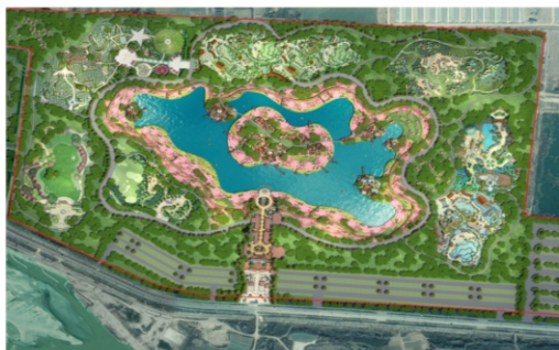
华侨城欢乐田园(规划示意图)