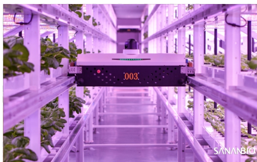
中科三安植物工厂