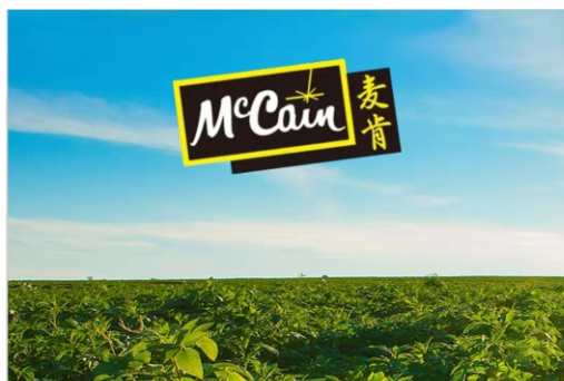
麦肯马铃薯产业园 potato Industrial Park of McCain