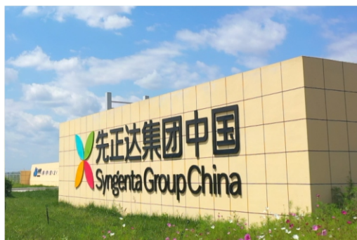
先正达集团 Syngenta Group China