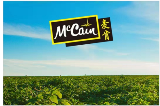
Картофельный промышленный парк Макон