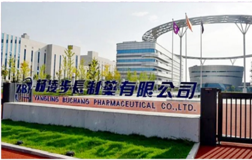
Фармацевтический завод Бучан