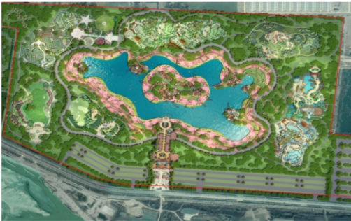
Развлекательная площадь Хуацзаочжн (схема планирования)