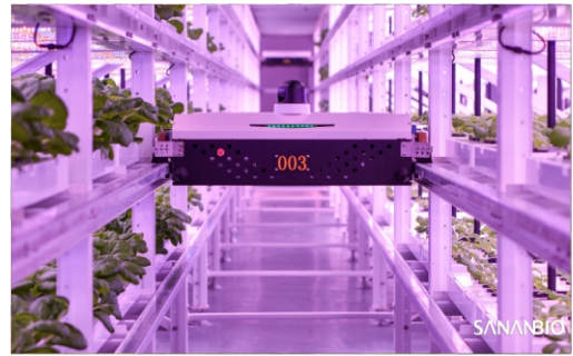
Завод растений Чжунке Санань