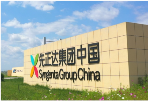
Группа компаний Сингента